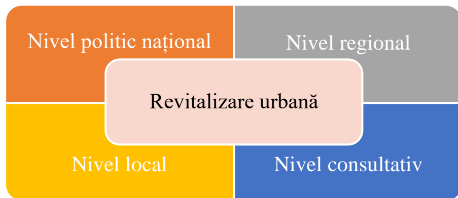
Fig. 1. Nivelele de responsabilitate

Eficiența procesului de revitalizare urbană, se caracterizează prin: cooperarea între instituțiile administrației publice la nivel central și local; cunoașterea realităților locale și identificarea măsurilor de intervenție; elaborarea și implementarea politicilor, programelor și proiectelor realiste de revitalizare urbană; parteneriate eficiente și durabile cu comunitatea locală, sectorul privat și toate părțile interesate; sprijin și deschidere către dialog cu structurile societății civile; informare și promovare.