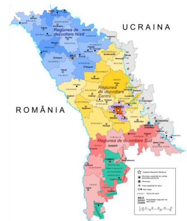
Figura 1. Harta regiunilor de dezvoltare