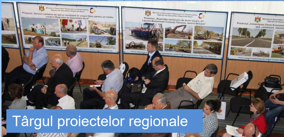
Târgul proiectelor regionale