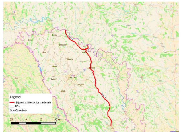
Harta 4. Traseul turistic național nr. 9

Beneficiarii excursiei: turiști interni, turiști străini, elevi, studenți, istorici.