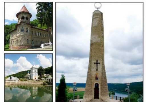
Bijuterii arhitectonice medievale